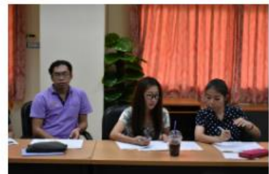
ภาพกิจกรรมการประชุมอาจารย์ใหม่เพื่อทำความเข้าใจกับการเป็นอาจารย์นิเทศนักศึกษาสหกิจ