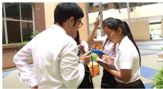
ภาพกระบวนการจัดการเรียนการสอนที่พัฒนากระบวนการคิด การสร้างสรรค์นวัตกรรม

3. การเตรียมความพร้อมให้กับนักศึกษาที่จะออกสหกิจศึกษา อบรมภาษาอังกฤษ