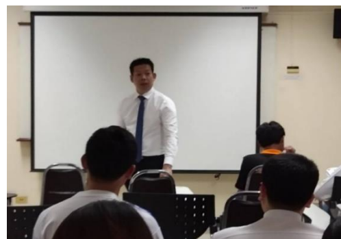
ภาพกิจกรรมการเตรียมความพร้อมก่อนออกสหกิจศึกษา/การอบรมภาษาอังกฤษ